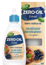
ERITRITOL LÍQ 65ML SKU: 20638-0 EAN: 7896094919136