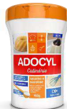
CULINARIO POTE 150G SKU: 19993-0 EAN: 7896094917439