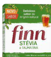
STEVIA PÓ 50X600MG SKU: 20836-0 EAN: 7898928577918