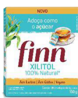
XILITOL PÓ 30X5G SKU: 20593-1 EAN: 7898928577789