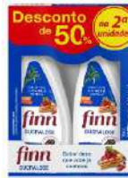
SUCRALOSE LIQ PACK 2X65ML SKU: 21103-0 EAN: 7898928577949