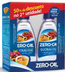
SUCRALOSE LIQ PACK PROMO 2X 100ML SKU: 19269-1 EAN: 7896094912779