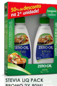
STEVIA LIQ PACK PROMO 2X 80ML SKU: 20637-0 EAN: 7896094919129