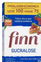
SUCRALOSE PÓ 100X600MG SKU: 20837-0 EAN: 7898928577925