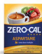
ASPARTAME PÓ 50X600MG SKU: 20751-0 EAN: 7896094919860