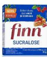
SUCRALOSE PÓ 50X600MG SKU: 20838-0 EAN: 7898928577932