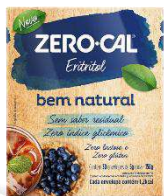
ERITRITOL PÓ 30X5G SKU: 20710-0 EAN: 7896094919624