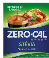
STEVIA PÓ 50X800MG SKU: 19632-0 EAN: 7896094915176