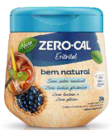
ERITRITOL POTE 250G SKU: 20742-0 EAN: 7896094919815