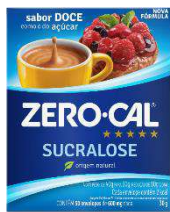
SUCRALOSE PÓ 50X600MG SKU: 20750-0 EAN: 7896094919853