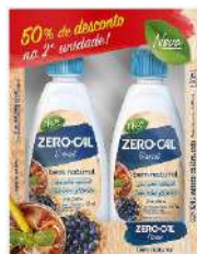
ERITRITOL LÍQ PACK 2X65ML SKU: 21519-1 EAN: 7896094999381