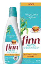
XILITOL LIQ 65ML SKU: 20570-1 EAN: 7898928577772