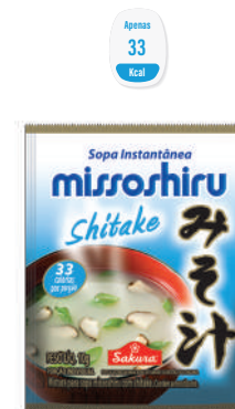
Missoshiru Shitake 10 g