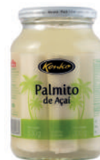
Palmito de Açaí em Conserva 300 g