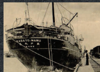
1908 Imigração Japonesa