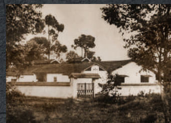
1940 Início da Sakura Alimentos