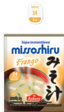
Missoshiru Frango 10 g