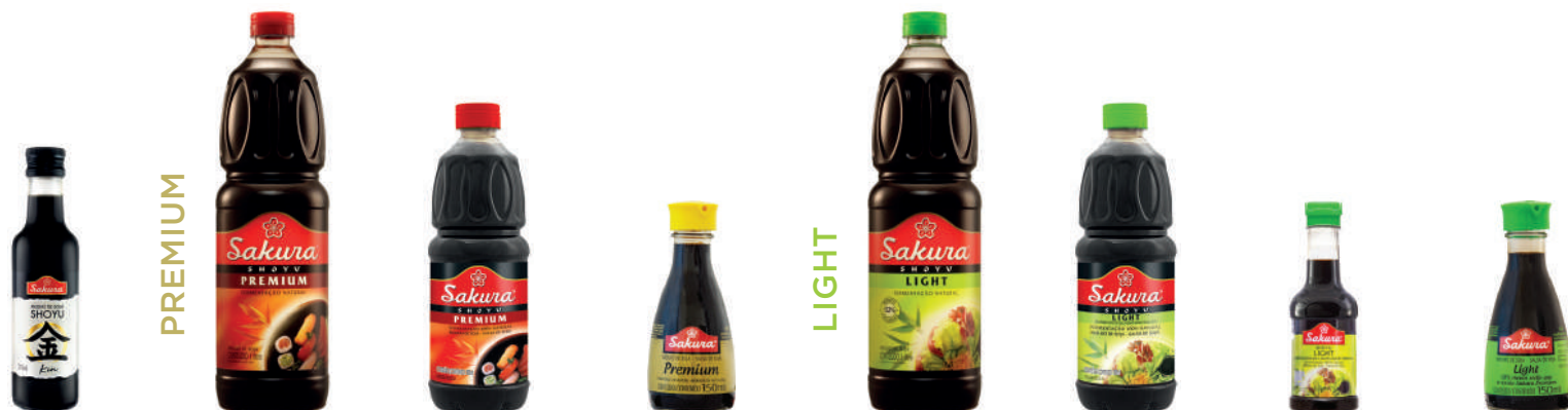
Molho Sakura Kin 250 ml Sakura Premium 1L Sakura Premium 500 ml Sakura Premium 150 ml Sakura Light 1L Sakura Light 500 ml Sakura Light 150 ml Sakura Light 150 ml

O Molho de Soja Sakura tem personalidade marcante, sabor e aroma que só Sakura tem. Isso muito se deve ao processo de fabricação, com exclusiva tecnologia de fermentação 100% natural de grãos de soja e milho não transgênicos. Um produto que dá um toque todo especial aos pratos do nosso dia a dia.