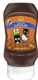
Hello Kitty Chocolate 250 g