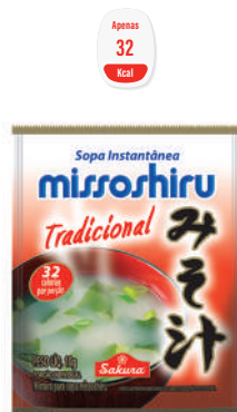
Missoshiru Tradicional 10 g