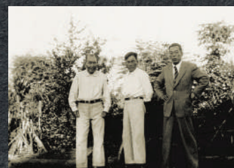
1940 Família Nakaya