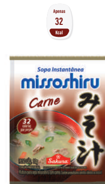
Missoshiru Carne 10 g