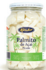
Palmito de Açaí Picado em Conserva 300 g