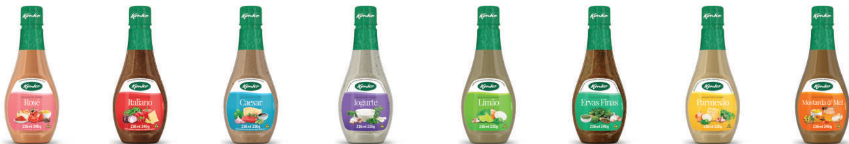
Rosé 236 ml Italiano 236 ml Caesar 236 ml Iogurte 236 ml Limão 236 ml Ervas Finas 236 ml Parmesão 236 ml Mostarda & Mel 236 ml