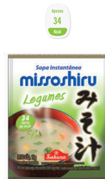
Missoshiru Legumes 10 g